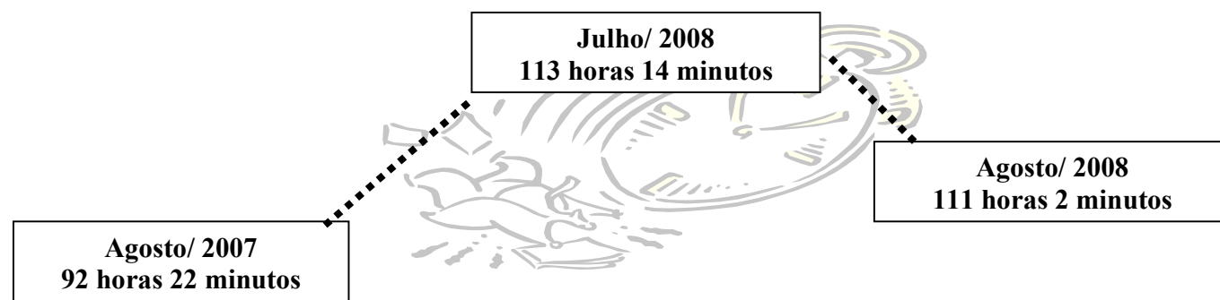
Número de horas trabalhadas para aquisição da Cesta Básica, como parte do tempo de trabalho utilizado na obtenção do Salário Mínimo (220 horas mensais) Uberlândia – MG

descanso remunerado, o trabalhador, em agosto de 2008, gastou 111 horas e 2 minutos para adquirir os treze produtos componentes da Cesta Básica necessários à sua sobrevivência, quantidade de horas menor se comparada com o mês anterior, que foi de 113 horas e 14 minutos.