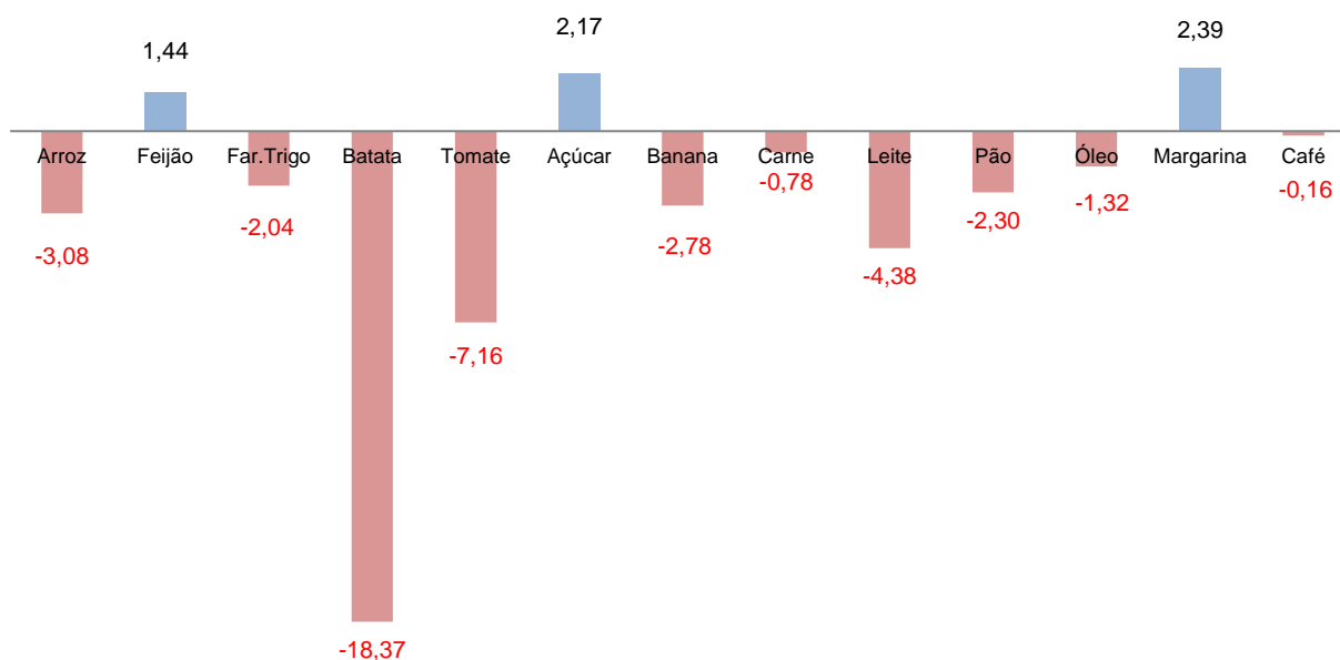
Gráfico 1. Cesta Básica de Alimentos de Uberlândia – produtos: variação mensal – fevereiro de 2021